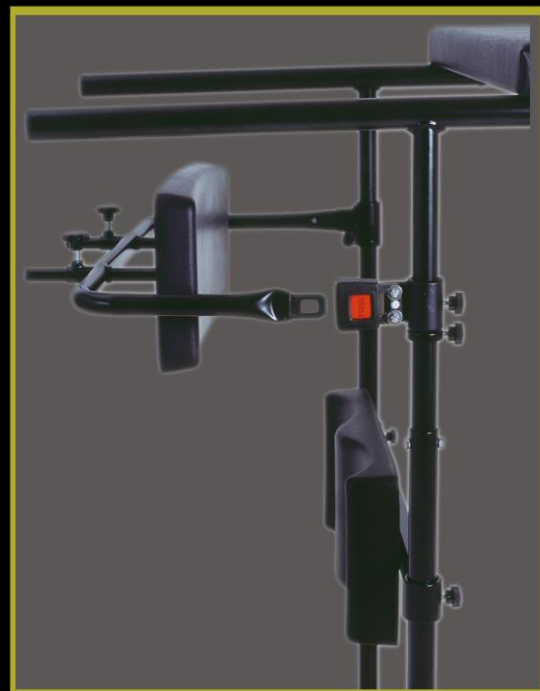
Anatomisch geformter, stufenlos verstellbarer Hüftpolster