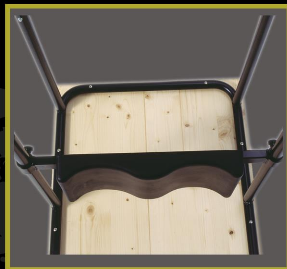
Anatomisch geformter, höhenverstellbarer Kniepolster